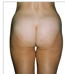
Dopo 14 sedute